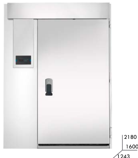
ABAT 40 - DIST