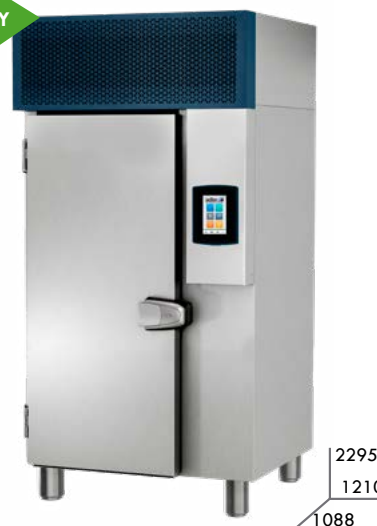
ABATIDOR 20 ROLLOUT