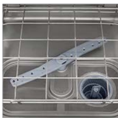
Con filtro de acero inox integral

1 AÑO GARANTÍA Condicional a uso, producto e instalaciones adecuadas.