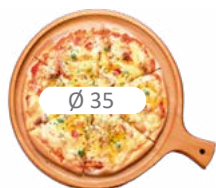
PIZZA GAS XL 6