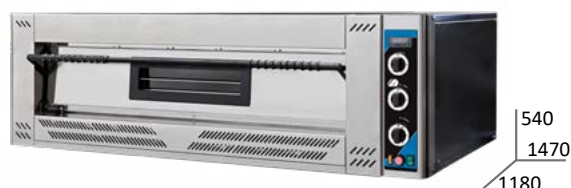
PIZZA GAS XL 6L