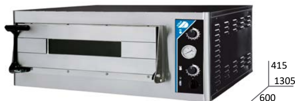
PIZZA MAXI 3LD35