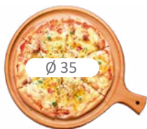
PIZZA MAXI 6D35