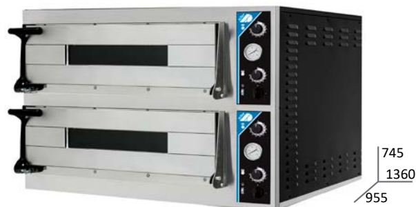
PIZZA MAXI 6LD35+ 6LD35