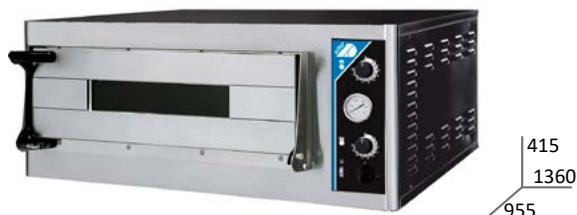
PIZZA MAXI 6LD35