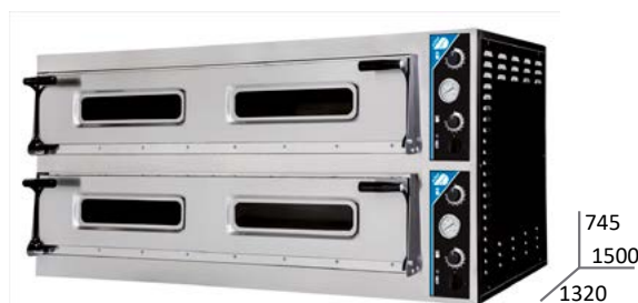
PIZZAPAN 6LD40 + 6LD40 POT